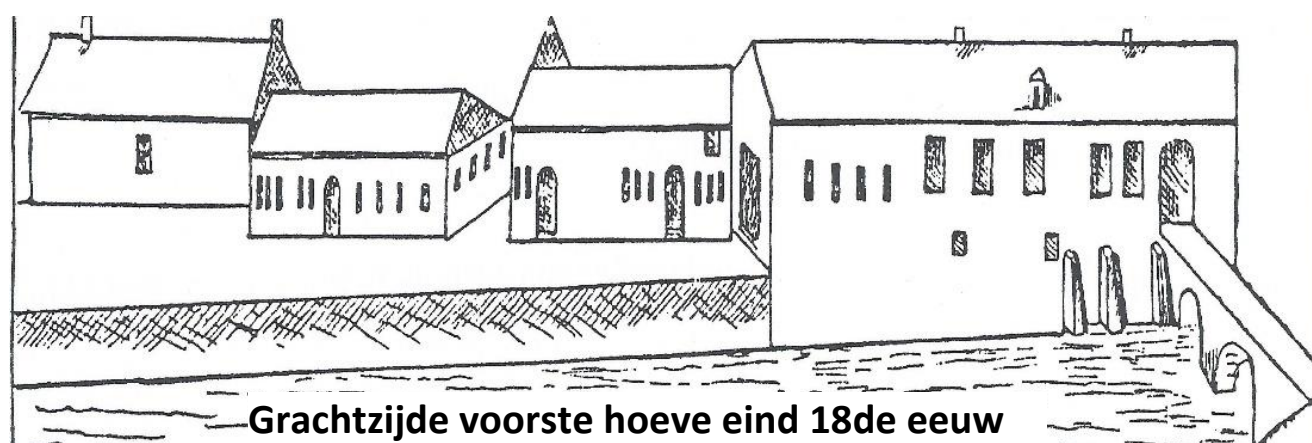
Grachtzijde voorste hoeve eind 18de eeuw

De hoeve bestond uit een keuken met haard (in 1820 is er sprake van een koperen fornuis), een wasplaats, "de grote kamer", een kleine kamer aan de kant van de koer, een kleine kamer achteraan, een slaapkamer boven de kelder, een bierkelder en een melkkelder en een zolder waar het personeel sliep. De stallingen bevonden zich tussen het woongedeelte en de poort; het gedeelte dus waar nu de cafetaria en de trapthal zijn. Verder was er nog een kleine schuur en werd een deel van de grote schuur gebruikt door de pachter van deze hoeve. In 1820 is er ook nog sprake van een "kamerken naest den balcon".