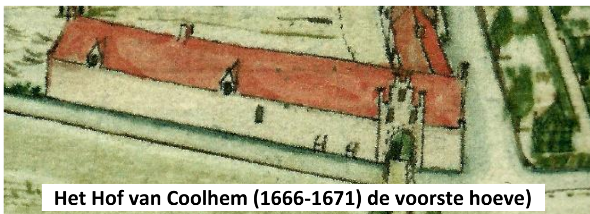
Het Hof van Coolhem (1666-1671) de voorste hoeve

Dit gebouw vormde de toegang tot het domein. Historisch en architecturaal onderzoek wees uit dat het oudste gedeelte ervan uit de 15e eeuw stamt; periode waarin de abdij van Hemiksem haar eerste grote bouwactiviteiten hier ontwikkelde.